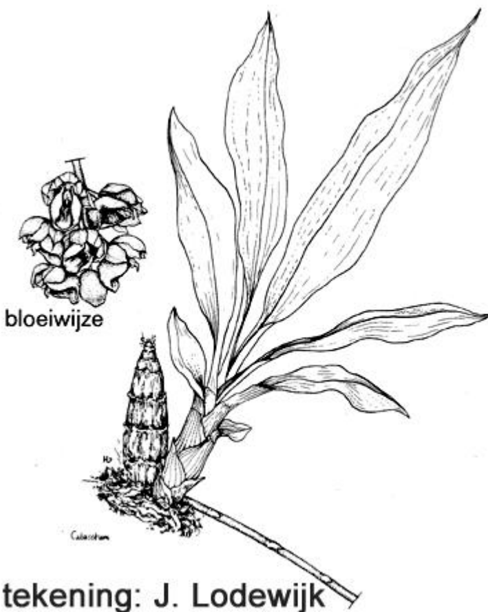
tekening: J. Lodewijk