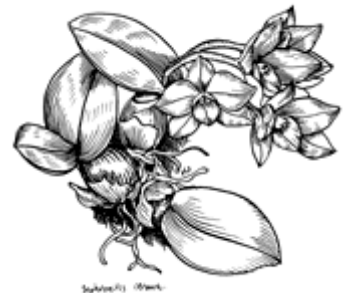
tekenina: J. Lodewijk