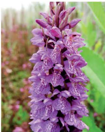
Rietorchis ( Dactylorhiza praetermissa )