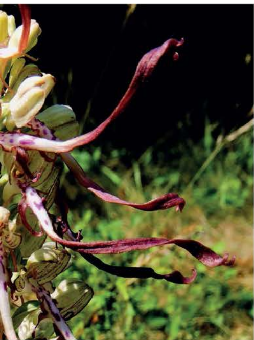
Bokkenorchis ( Himantoglossum hircinum )