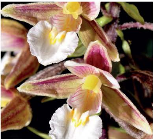
Moeraswespenorchis ( Epipactis palustris )

gemeente zijn afspraken gemaakt hoe en wanneer de bermen te maaien om zo de orchideevriendelijke omgeving te behouden.