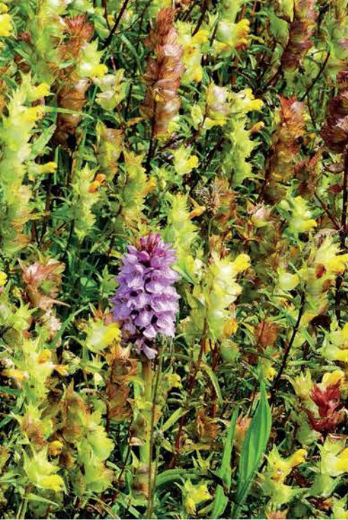
missa) temidden van Kleine ratelaar ( Rhinanthus minor )