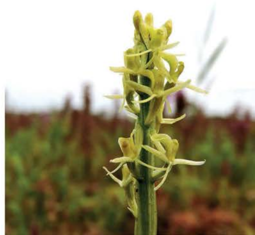
Groenknolorchis ( Liparis loeselii )