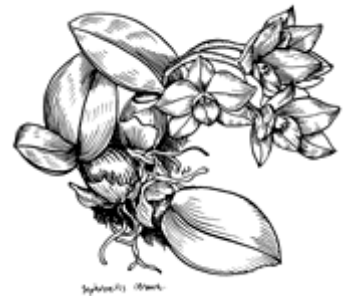
tekenina: J. Lodewijk