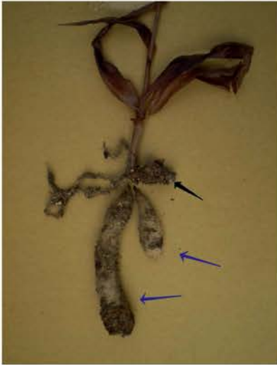
Habenaria medusa , knollen. De zwarte pijl geeft de oude en inmiddels dode knol. De blauwe pijlen wijzen naar de nieuwe knollen. Deze plant heeft een grote vervangende knol plus een extra knol gemaakt en zal volgend jaar nog rijker bloeien

geval is de plant dus dood). Heeft de plant het redelijk gedaan, dan is er een knol van ongeveer dezelfde grootte gevormd.