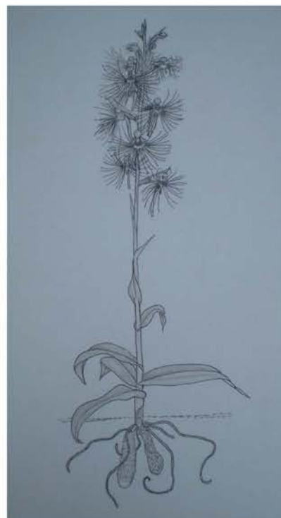
Habenaria medusa , overzicht van de plantbouw

De knollen van Habenaria medusa leven maar één seizoen. Om te overleven moet de plant dus een vervanger maken. Het formaat van deze vervanger is een indicatie van hoe de plant het naar zijn zin heeft gehad. Als de plant het niet goed heeft gedaan, is er een kleinere of misschien zelfs geen nieuwe knol gevormd (in het laatste