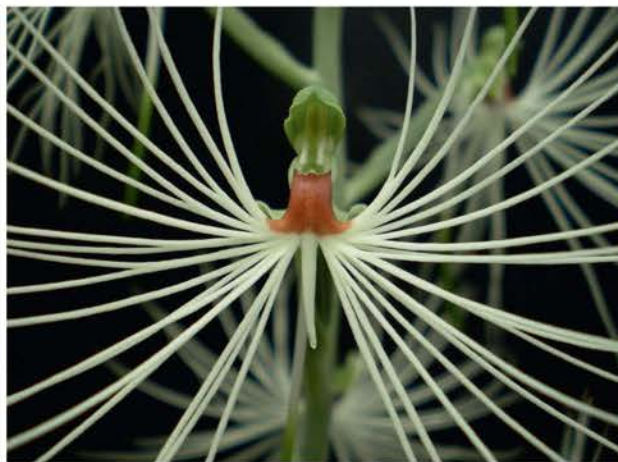
Close-up van de lip