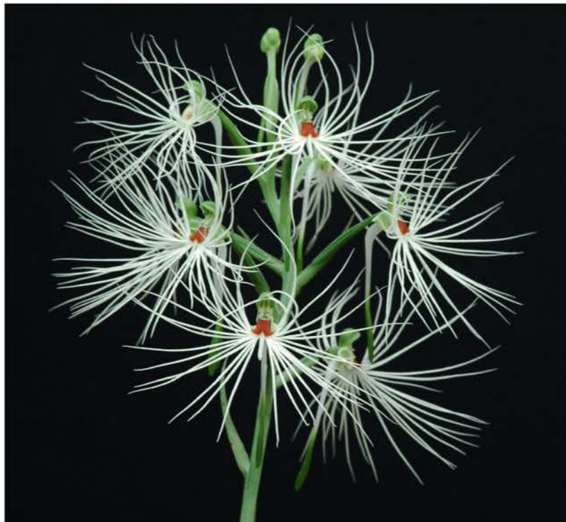
Habenaria medusa , bloeiwijze

Deze Habenaria , net als de meeste van haar zusters, heeft een hekel aan water dat langdurig op de bladeren blijft staan. Een bedompte kas is dus de plek waar deze plant geen lang leven is beschoren. De bladeren zijn dunner dan die van de meeste epifyten, maar toch zijn ze bestand tegen de droge warme lucht in de huiskamer.