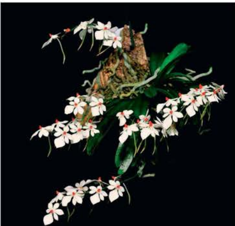
Aerangis luteoalba var. rhodosticta van Jan Imhof, zilver (8.1 punten)