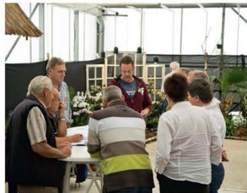
De keuringscommissie in overleg

Aan publieke belangstelling was, ondanks het slechte weer, geen gebrek. Het aantal bezoekers is geraamd op 2000-2500. De onderdak verlenende bloemisterij zorgde voor een zeer ruim en gevarieerd aanbod aan orchideeën, die gretig aftrek vonden. De beide organiserende Kringen kijken met grote tevredenheid terug op dit evenement: het aantal ingezonden planten overtrof de verwachting, het publiek toonde zich enthousiast, de clubgeest kreeg een positieve impuls en het financiële resultaat was positief. De Kring Oost-Nederland voegt daar nog aan toe: we hebben een zeer geslaagde viering van ons 40-jarig jubileum gehad.