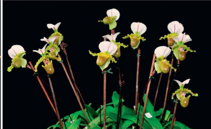
Schitterende groep Paphiopedilum spicerianum van de firma Röllke uit Duitsland, zilver (8.1 punten)