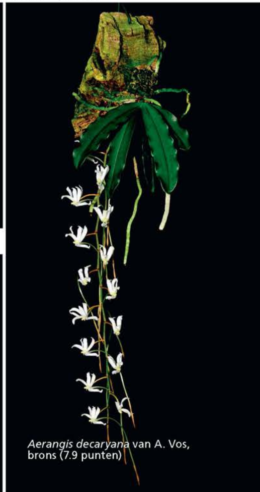
Aerangis decaryana van A. Vos, brons (7.9 punten)