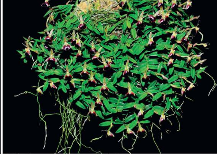
Epidendrum peperomia van Dirk de Haan, goud (9.0 punten)