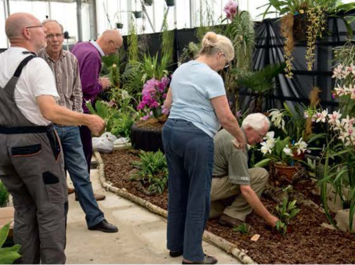
De opbouw van de presentatie van Kring Oost-Nederland