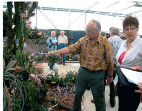
De keuringscommissie in actie

De centrale vijver, prachtig aangelegd door medewerkers en leerlingen van het Agrarisch OpleidingsCentrum in Twello