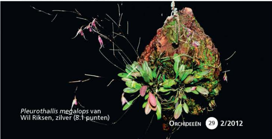
Pleurothallis megalops van Wil Riksen, zilver (8.1 punten)