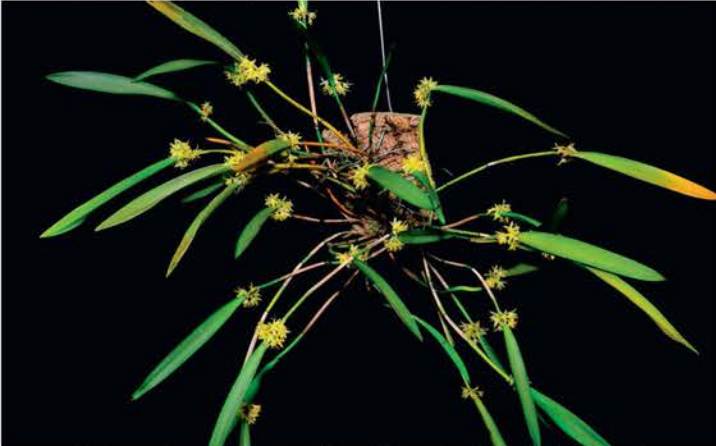
Octomeria concolor van Hans Tesson, zilver (8.5 punten)