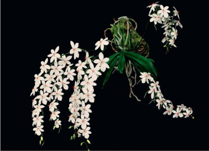
Aerangis luteoalba var. rhodosticta van A. Vos, goud (9.1 punten)