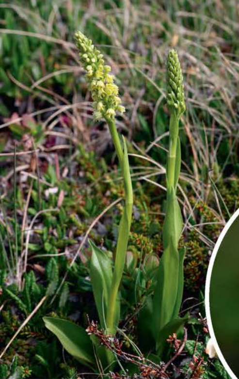
Pseudorchis albida (synoniem: Gymnadenia albida ; Witte muggenorchis)